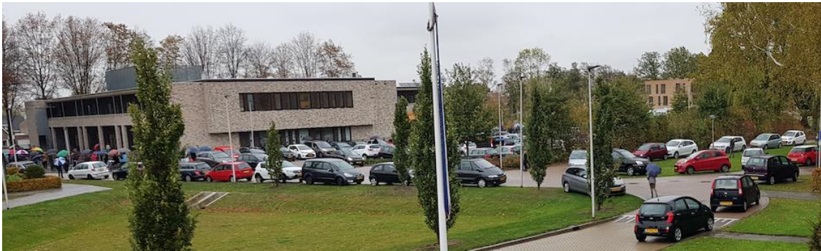
Chaotische tafereelen aan de Edward Poppelaan