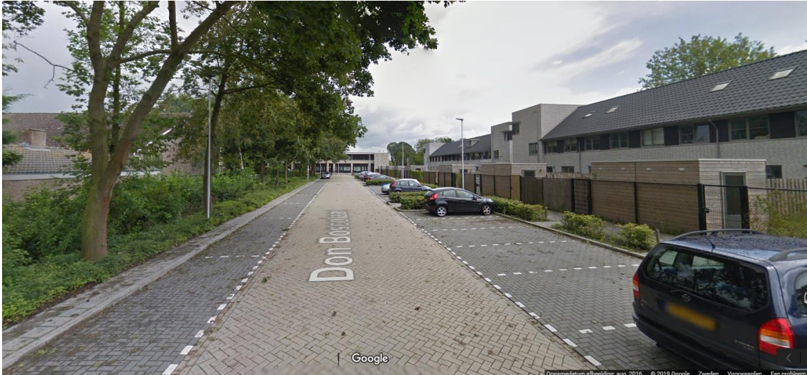
Parkeerplaatsen Don Boscolaan