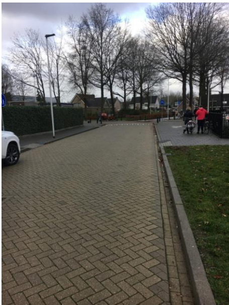
Dubbele voetgangsoversteek aan de Edward Poppelaan. Graag vrijhouden!