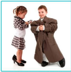
O.R. & M.R.